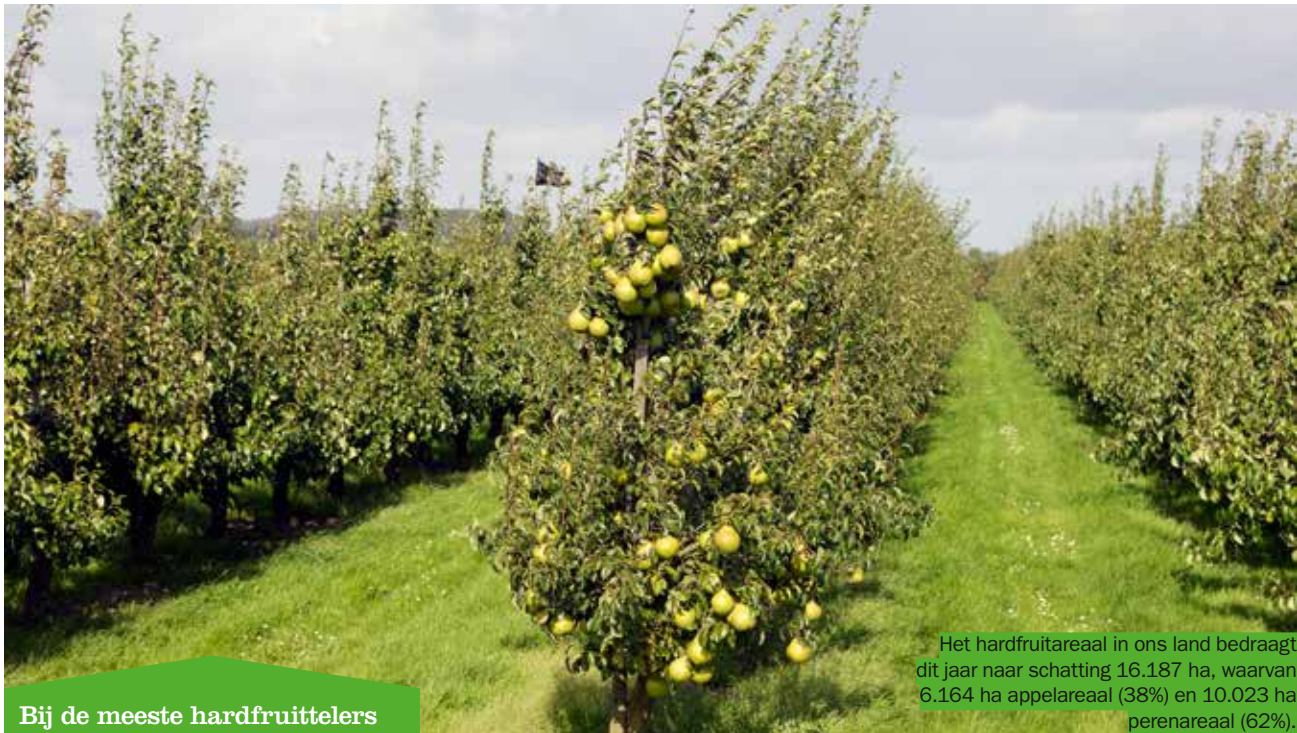
Het hardfruitareaal in ons land bedraagt dit jaar naar schatting 16.187 ha, waarvan 6.164 ha appelareaal (38%) en 10.023 ha perenareaal (62%).

Bij de meeste hardfruittelers is de nieuwe oogst bijna achter de rug. Omwille van de droge eerste jaarhelft en de hittegolf in juni begon het plukken overigens twee weken vroeger dan normaal. Door de weersomstandigheden is tevens sprake van lagere oogstvolumes voor zowel appelen als peren. Dit zal op onze veiling een invloed hebben op de aanvoeren omzetcijfers voor hardfruit. In het seizoen 2016/2017 zaten deze cijfers voor het derde jaar op rij in de lift.