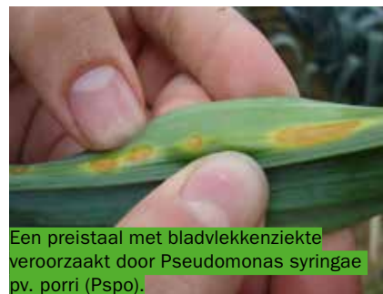
Een preistaal met bladvlekkenziekte veroorzaakt door Pseudomonas syringae pv. porri (Pspo).

In het kader van dit onderzoek met projectpartners KU Leuven, ILVO, PCG en PSKW, doet Inagro een oproep om aangetaste kool- en preiplanten bij haar te signaleren. Dit moet de onderzoekers toelaten om de aantasting door bacterieziekten beter in kaart te brengen. Concreet gaat het over zwartnervigheid in kool en bladvlekkenziekte in prei, respectievelijk veroorzaakt door Xanthomonas campestris pv. campestris (Xcc) en Pseudomonas syringae pv. porri (Pspo). Merk je bacteriesymptomen op in je gewas? Neem dan contact op met Sabien Pollet van Inagro via 051 27 33 04 of sabien.pollet@inagro.be . Het proefcentrum komt dan langs om stalen te nemen van zowel de aangetaste planten als de bodem in de directe buurt van de aangetaste planten.