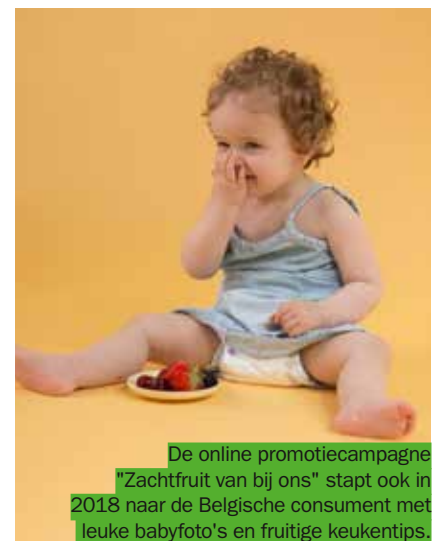
De online promotiecampagne “Zachtfruit van bij ons” stapt ook in 2018 naar de Belgische consument met leuke babyfoto's en fruitige keukentips.

VLAM promoot Flandria natuurlijk ook op Europese vakbeurzen. In 2018 heeft VLAM traditiegetrouw een beursstand op Fruit Logistica in Berlijn (07-09/2) en Fruit Attraction in Madrid (23-25/10). VLAM ondersteunt beide beursdeelnames met Flandria publiciteit in de toonaangevende Europese vakbladen.