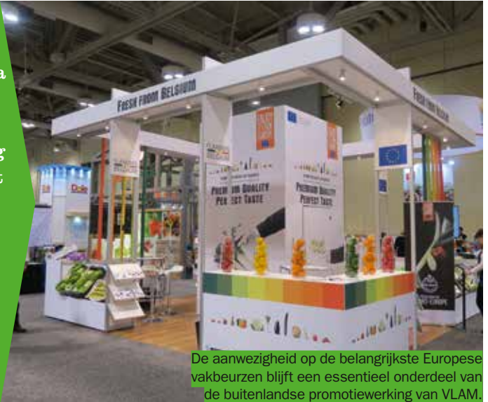
De aanwezigheid op de belangrijkste Europese vakbeurzen blijft een essentieel onderdeel van de buitenlandse promotiewerking van VLAM.

Het Vlaams Centrum voor Agro- en Visserijmarketing (VLAM) besteedt dit jaar 4 miljoen euro voor de promotie van Flandria groenten en fruit op zowel de lokale markt als in het buitenland. VLAM zet daarbij verder in op de strategische keuzes van vorig jaar. Wat betekent dat VLAM in ons land met publiciteitsacties zowel handelaars als consumenten zal aanmoedigen om voluit de kaart van “Lekker van bij ons” te trekken. Het exportprogramma van VLAM focust op een versterking van de professionele contacten met handelspartners op basis van vooral marktprospecties en beursdeelnames.