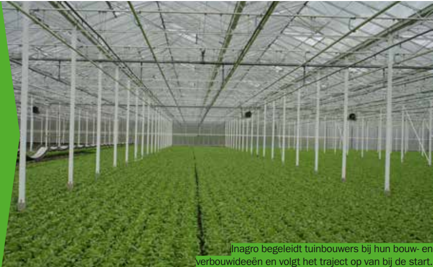
Inagro begeleidt tuinbouwers bij hun bouw- en verbouwideeën en volgt het traject op van bij de start.

Een bouwvergunning krijgen voor bijvoorbeeld een nieuwe loods of de uitbreiding van een bestaande serre is in de praktijk niet altijd een eenvoudig verhaal. Daarom biedt Inagro begeleiding aan voor tuinbouwers die hun bedrijfsinfrastructuur willen uitbreiden of vernieuwen. Deze dienstverlening is gratis en stelt flexibele oplossingen voor op maat van je bouwdoosier.